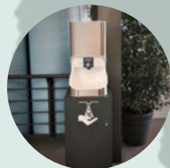
Swiss Economic Forum ŠVÝCARSKO