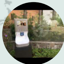
Světová zdravotnická organizace (WHO) FILIPÍNY