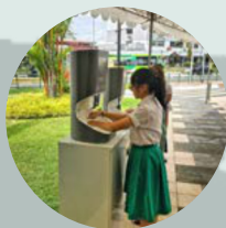
Public Middle School SINGAPORE