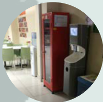
Torapetrol Cantine TURECKO