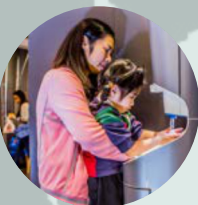
KFC HONG KONG