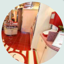
Carnival Cruiselines OTEVŘENÉ MOŘE