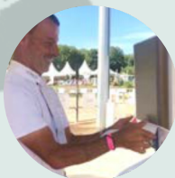
House Jumping Show FRANCIE