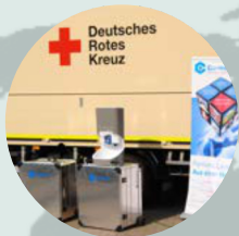
Červený kříž NĚMECKO