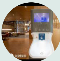
Courtyard by Marriott Hotels TAIWAN

Smixinstanice na mytí rukou jsou užívány v mnoha průmyslových odvětvích. Smixin spolupracuje s mnoha mezinárodními značkami jako je McDonald's , Virgin , ShakeShack , KFC , Mariott , Ruby Tuesday , Firmenich a CWS , ale také se zdravotnickými centry, dopravními uzly, školami a vládními budovami. Naši zákazníci si cení pozitivního dopadu na životní prostředí a velké úspory vody, mýdla a papíru. Cení si možnosti mít mycí jednotky přesně tam, kde jsou potřeba: mimo koupelny a umývárny. Posledním krokem, vedoucím k rozhodnutí používat Smixinstanice, jsou skvělé výsledky v oblasti hygieny.