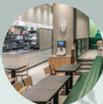
ShakeShack JIŽNÍ KOREA