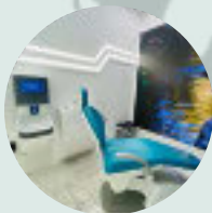
Dubai Healthcare Centre DUBAJ