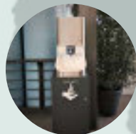
Swiss Economic Forum ŠVÝCARSKO