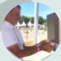
House Jumping Show FRANCIE