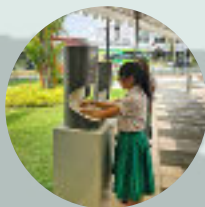
Public Middle School SINGAPORE