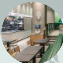
ShakeShack JIŽNÍ KOREA