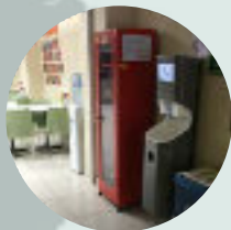
Torapetrol Cantine TURECKO