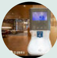
Courtyard by Marriott Hotels TAIWAN

Smixinstanice na mytí rukou jsou užívány v mnoha průmyslových odvětvích. Smixin spolupracuje s mnoha mezinárodními značkami jako je McDonald's , Virgin , ShakeShack , KFC , Mariott , Ruby Tuesday , Firmenich a CWS , ale také se zdravotnickými centry, dopravními uzly, školami a vládními budovami. Naši zákazníci si cení pozitivního dopadu na životní prostředí a velké úspory vody, mýdla a papíru. Cení si možnosti mít mycí jednotky přesně tam, kde jsou potřeba: mimo koupelny a umývárny. Posledním krokem, vedoucím k rozhodnutí používat Smixinstanice, jsou skvělé výsledky v oblasti hygieny.