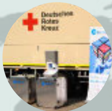
Červený kříž NĚMECKO