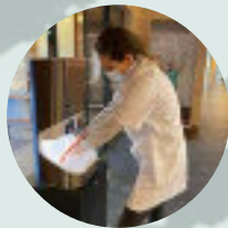
Sint Jacob Kliniek NIZOZEMÍ